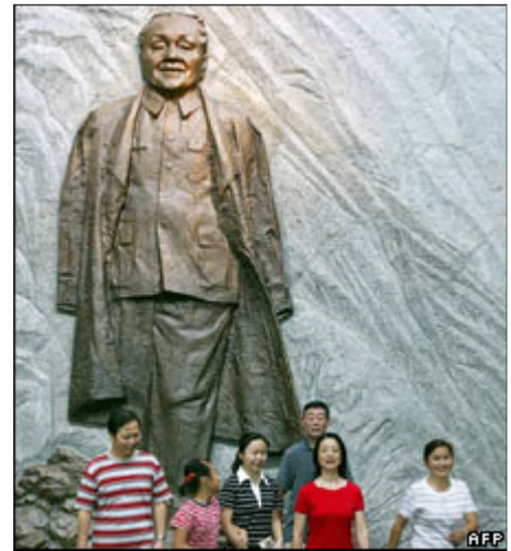
Ông Đặng Tiểu Bình được vinh danh là kiến trúc sư của công cuộc cải cách Trung Quốc

....Nhưng rồi càng ngày hình như người ta lại càng mê mẩn với cái chiều mới này và thông tin cứ thế lại sa vào con đường một chiều mới. Hơn nữa, người ta đã không chỉ dừng lại ở chỗ phổ biến những chính sách khôn ngoan của ông Đặng và coi đó là kinh nghiệm và kiến thức quý báu cho các nhà hoạch định chính sách VN học tập. Đây là chưa nói đến liệu những chính sách của ông Đặng có xứng đáng được đề cao quá mức đến thế hay không khi thực chất chỉ là đưa Trung Quốc trở lại con đường phát triển hợp quy luật hơn mà đại đa số các nước vẫn minh trên thế giới đang đi.