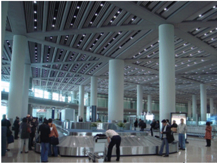
Một trong những quầy nhật hàng hóa ở nhà ga số 3 phi trường Bắc Kinh

Trước tiên, cửa ngõ đến Trung Quốc là phi trường Bắc Kinh. Trung Quốc đã phô trương cho thế giới thấy sự vĩ đại của mình qua phi trường Bắc Kinh đã khánh thành nhân Thế Vận Hội 2008 với một nhà ga mới gọi là nhà ga số 3. Rộng gấp 2 lần tòa Bạch Ốc, lớn hơn cả nhà ga của phi trường Heathrow ở Luân Đôn được xem là lớn nhất trước đó, nhà ga của phi trường Bắc Kinh rộng 98 mẫu, được trang bị và kiến trúc tân kỳ, hiện đại, được xem là nhà ga lớn nhất thế giới hiện nay và được xếp hạng là phi trường thứ tư trong 10 phi trường lớn nhất thế giới (theo bảng xếp hạng của ACI năm 2009, phi trường số 1 thế giới là Hartsfield Jackson Atlanta tiếp nhận 59 triệu hành khách, thứ nhì là London Heathow: 44 triệu, thứ ba là O'Hare Chicago : 43,5 triệu, thứ tư là Beijing Int. Airport : 43 triệu; thứ 10 là HongKong Int. Airport : 30 triệu). Như vậy, chỉ riêng Trung Quốc đã có 2 phi trường trong top 10.